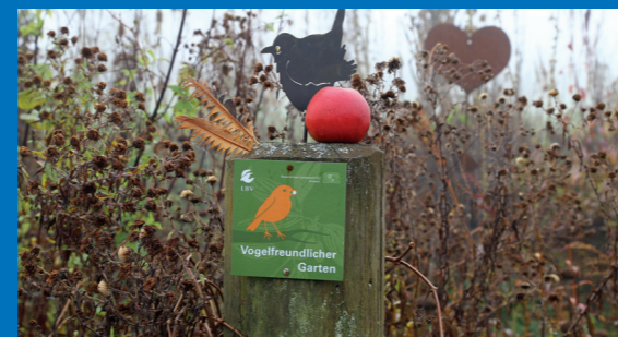
Ein ausgezeichnete Garten für Vögel